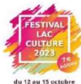
Festival Lac Culture