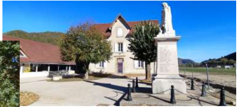
Aménagement Cœur de village