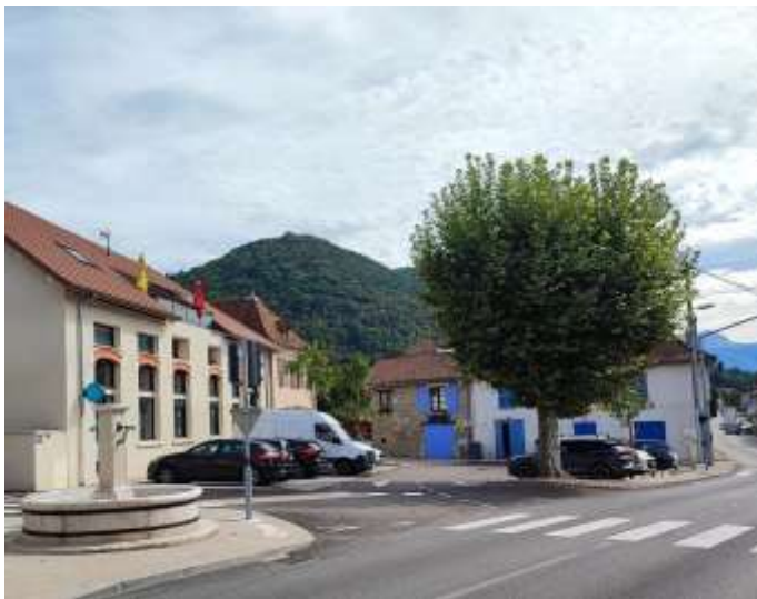
Place de la Fontaine