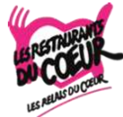
Antenne à Chirens