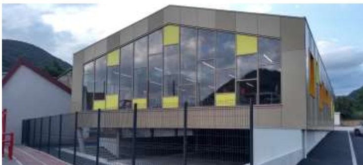
Réaménagement et extension de l'école élémentaire