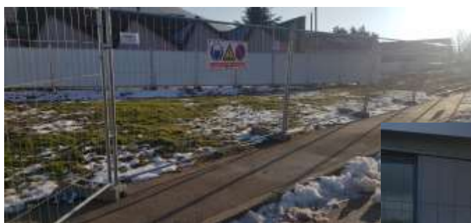
Extension école élémentaire