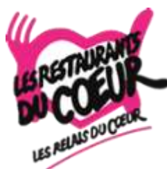
Antenne à Chirens