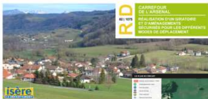
Concertation Carrefour de l'Arsenal