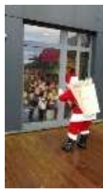
Père Noël aux écoles 2022