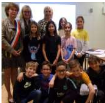
Conseil municipal des enfants