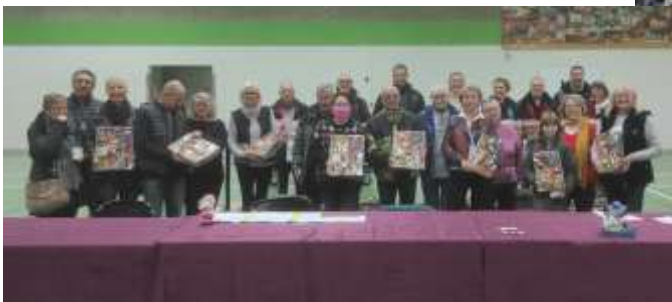
Colis des Aînés

Ces rencontres ont permis de privilégier le contact humain, la joie : l'initiative ravit.