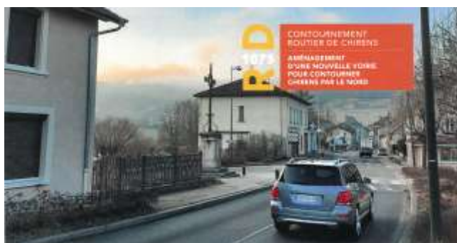
Concertation Contournement de Chirens