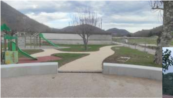
Aménagement Cœur de village