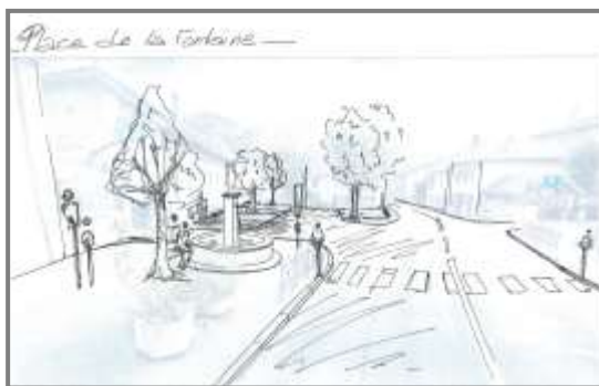
Aménagement Place de la Fontaine