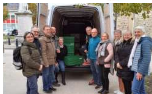
Les bénévoles des « Restos » à Chirens